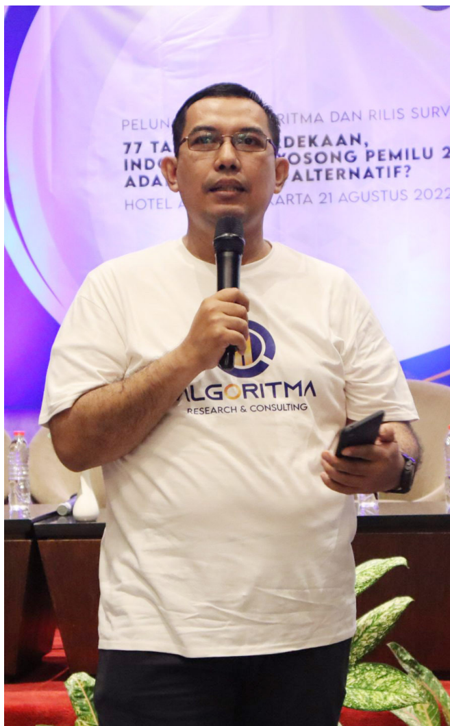
DIREKTUR EKSEKUTIF ALGORITMA RESEARCH AND CONSULTING DOSEN ILMU POLITIK FISIP UNIVERSITAS INDONESIA

Namun, keputusan MK hanya akan jadi arsip mati jika pemerintah tidak berani memimpin revisi Undang-Undang Pemilu secara serius. Kini, saatnya pemerintah membuktikan komitmen