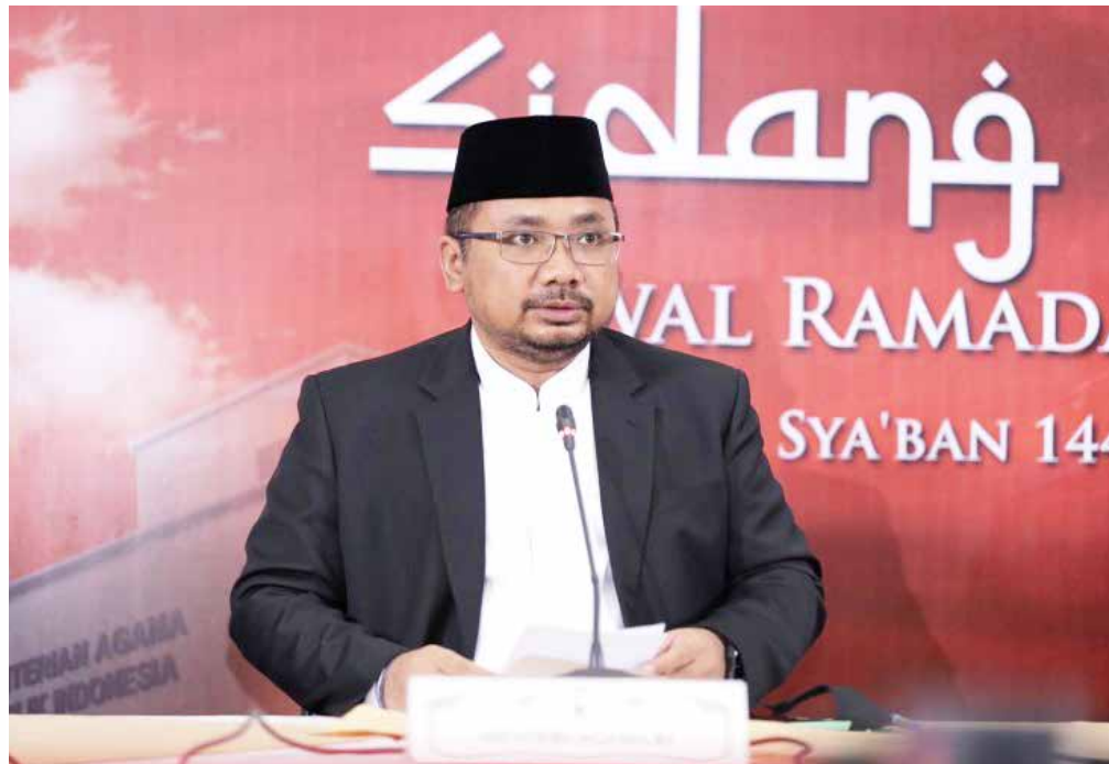
Menteri Agama, Yaquut Cholil Qoumas

Selain itu, Yaquut juga mendiskusikan kemungkinan jumlah kuota haji Indonesia dengan Tawfiq. Menag berharap