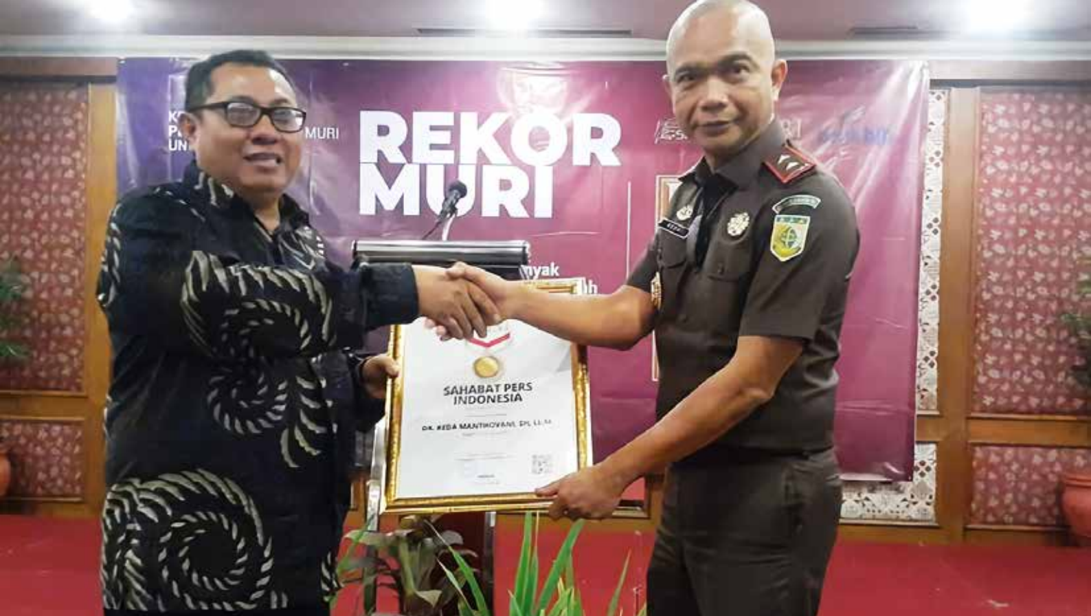
Kepala Kejaksaan Tinggi DKI Jakarta, Reda Manthovani, meraih anugerah Sahabat Pers Indonesia dari Serikat Media Siber Indonesia (SMSI) yang diberikan langsung oleh Ketua Umum SMSI Pusat, Firdaus di salah satu hotel di Jakarta, 22 Maret 2022.

menetapkan siapa pengantannya, tersangkanya, sudah dikantongi si nama-nama tersebut, Cuma kan saksi inti ini belum kita periksa, jadi kita belum berani. Setelah 30 hari kita tangkep aja langsung kalau dia nggak datang-datang juga.