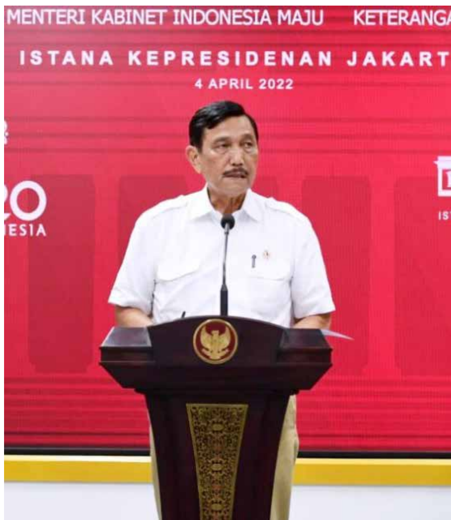
Menteri Koordinator Kemaritiman dan Investasi, Luhut Binsar Pandjaitan

LKPP telah memutuskan untuk melakukan akselerasi melalui otomasi pendaftaran penyedia katalog elektronik. Sehingga proses bisnis yang sebelumnya banyak dilakukan secara manual dengan melibatkan SDM akan dipangkas dan dilakukan otomatis melalui sistem. Maka, ketika pelaku usaha sudah terdaftar sebagai penyedia barang/jasa dan masuk ke dalam database OSS, mereka akan bisa segera melakukan penayangan produk dalam katalog lokal secara mandiri.