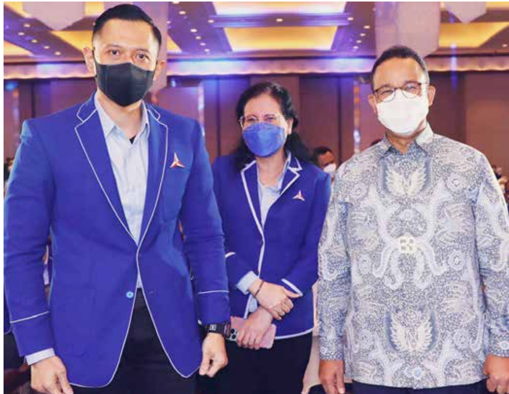
Agus Harimurti Yudhoyono (AHY) dan Anies Baswedan

"Kami pun bersyukur dan mengapresiasi keinginan kuat rakyat yang memasukkan kader terbaik Demokrat saat ini, Agus Harimurti Yudhoyono, sebagai salah satu tokoh yang dianggap pantas sebagai calon pimpinan nasional di Pilpres 2024. Tentunya hasil yang ditunjukkan sejumlah lembaga survei ini menjadi salah satu