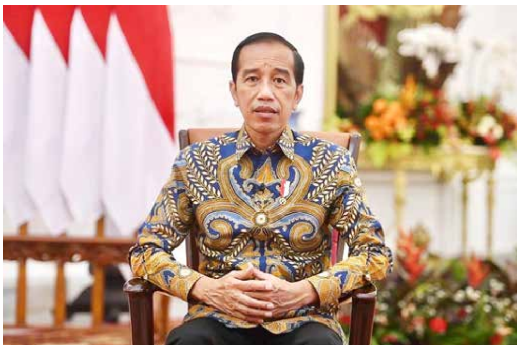
Presiden Joko Widodo

"Hal pertama yang kita lakukan adalah memangkas birokrasi/tahapan untuk masuk ke e-katalog, baik itu e-katalog nasional maupun lokal. Soal e-katalog nasional, kini dalam proses meringkas alur penayangan produk