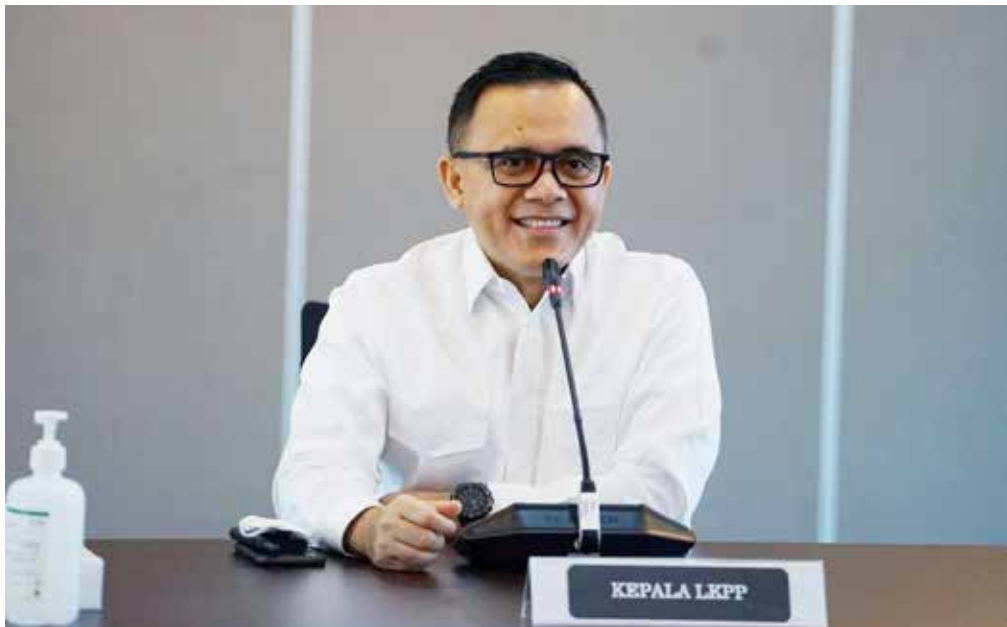
Kepala Lembaga Kebijakan Pengadaan Barang/Jasa Pemerintah, Abdullah Azwar Anas

Menurut dia, ekosistem bisa terjadi kalau semua pemangku kepentingan, pengambil kebijakan, dan generasi muda mengambil perannya. "Kita punya hal yang sudah kita miliki yakni gotong royong. Kita sudah punya fondasi itu, jadi bukan fondasi atau kepercayaan baru. Kita sudah memilikinya dalam budaya kita," katanya.