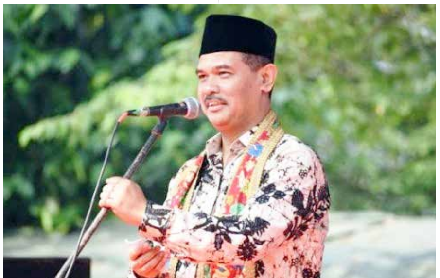
Dirjen Tanaman Pangan, Kementan, Suwandi

Peningkatan produksi padi di Provinsi Lampung ini mendapat dukungan penuh dari Kementerian Pertanian