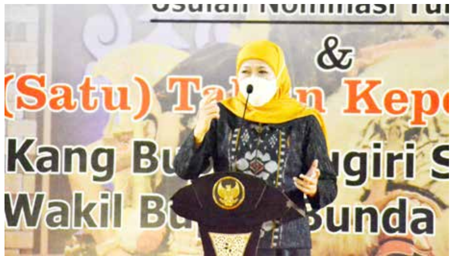
Gubernur Jawa Timur Khofifah Indar Parawansa

"Jika mereka mengklaim, maka harus kita lawan, kebenaran itu bisa disalahkan, tapi kebenaran tidak bisa dikalahkan," tegas dia.