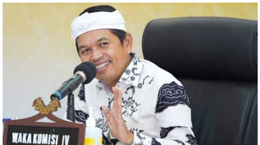
Anggota DPR RI, Dedi Mulyadi

Jawa Timur Khofifah Indar Parawansa bersama Bupati Ponorogo untuk mempertahankan kesenian Reog Ponorogo Jawa Timur, Indonesia. LaNyalla juga menegaskan bahwa kesenian ini benar-benar milik Indonesia, sehingga tidak ada negara atau pihak manapun yang berhak mengklaim.